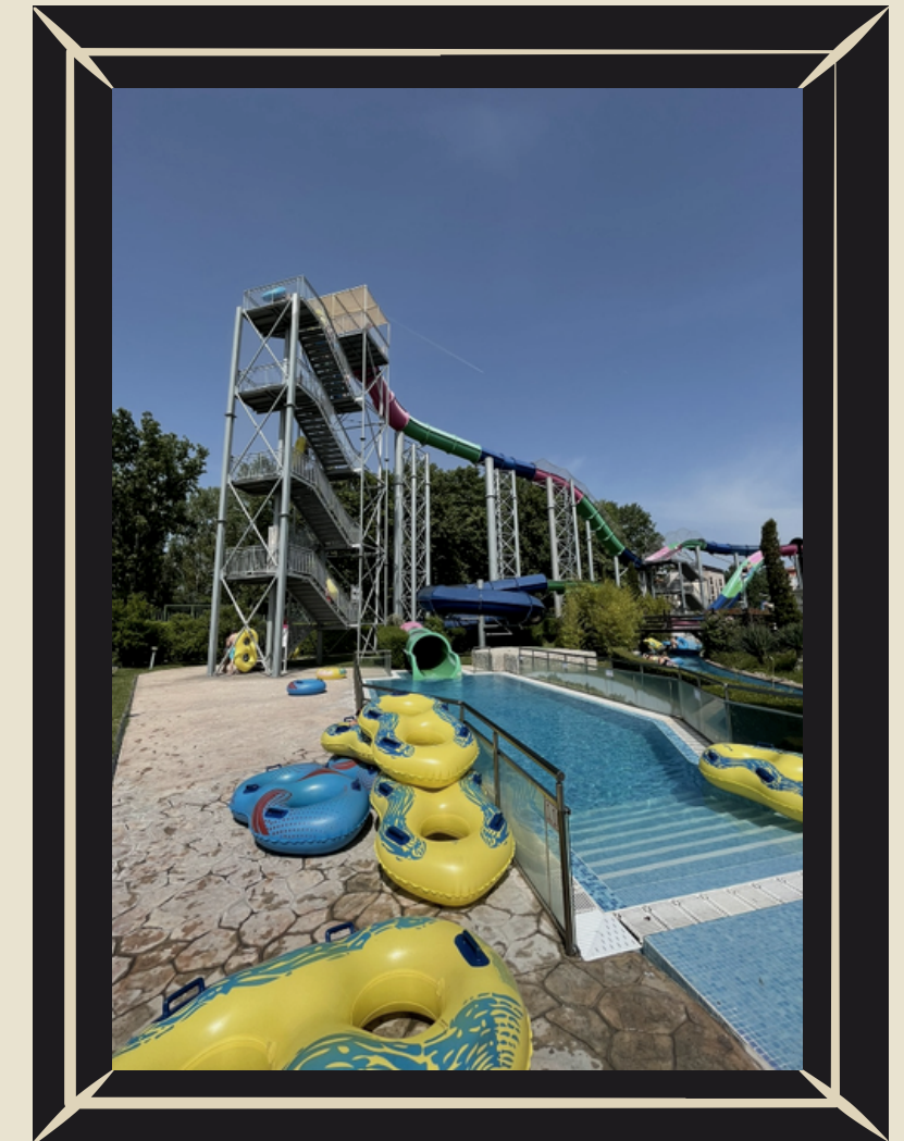
Мало жителей . ГИГАНТСКИЙ АКВАПАРК

Достопримечательностью города является памятник Святому Николаю - местные говорят, что рядом с ним постоянно сидят бакланы. Я лично могу подтвердить этот факты!