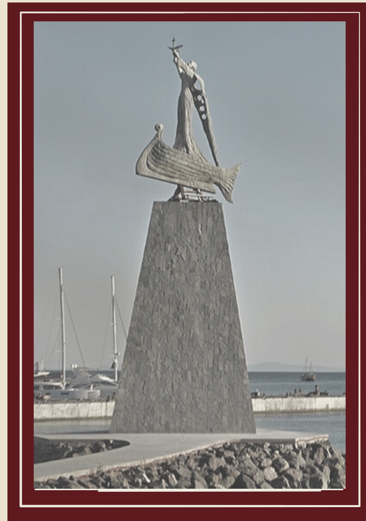
Святой Николай и бакланы

Символом города, считается старинная ветровая мельница, которая стоит на границе старого и нового города.